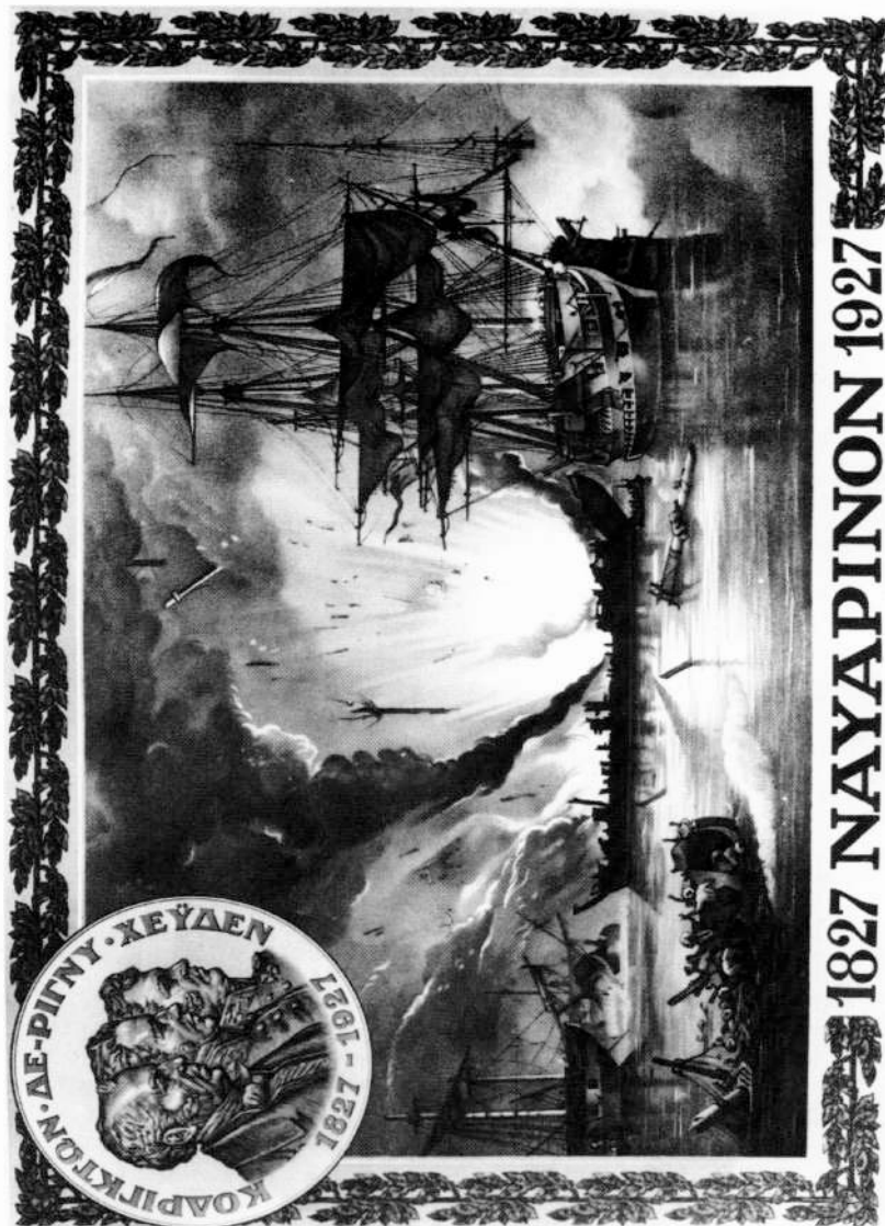
18. ΓΑΚ, Κατάλογο Ι. Δαμβέργη, Φάκ. 77α