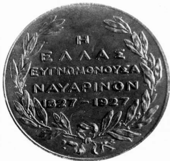
19. ΓΑΚ, Κατάλοιπα Ι. Δαμβέργη, Φάκ. 78α