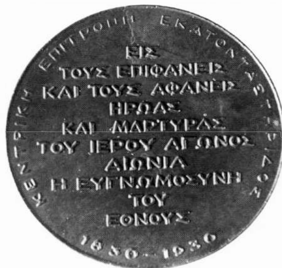
20. ΓΑΚ, Κατάλοιπα Ι. Δαμβέργη, Φάκ. 78β