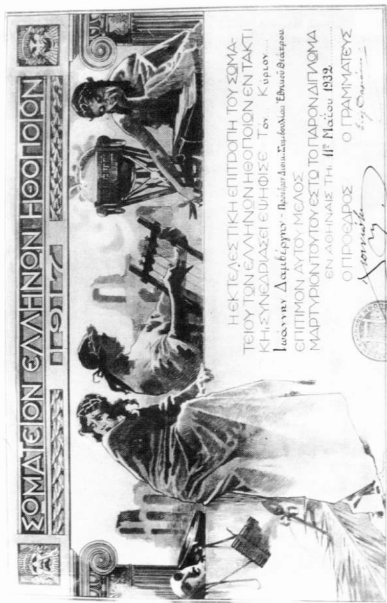
16. ΓΑΚ, Κατάλοιπα Ι. Δαμβέργγυ, Φάκ. 76 - Υποφ. 8